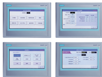
触摸屏控制器操作界面