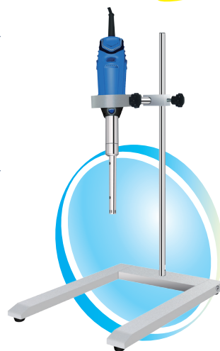
B-170手持式均质分散机