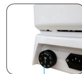
独立限温报警系统