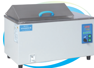
振荡水槽 DKZ-1/DKZ-2 DKZ-3/DKZ-2B