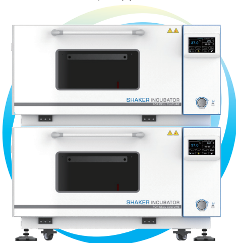
HZQ-102(C) HZQ-112(C) HZQ-122(C)