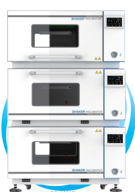
HZQ-103(C) HZQ-113(C) HZQ-123(C)