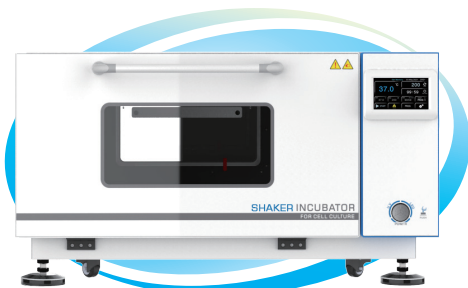
HZQ-101(C) HZQ-111(C) HZQ-121(C)