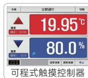
可程式触摸屏控制器